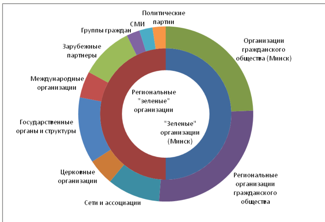
Диаграмма 3. Типы структур, вступающих во взаимодействие